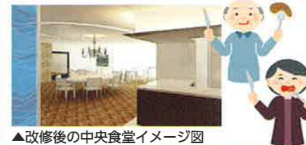
▲改修後の中央食堂イメージ図