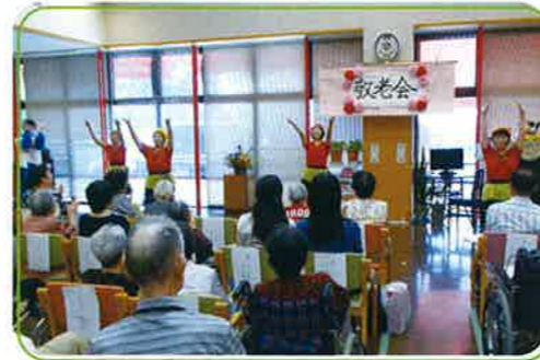
▲天女浜ダンサーズによる踊りの鑑賞