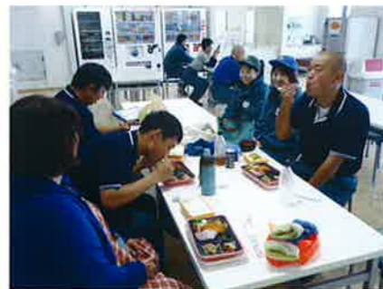
▲従業員の方々と食事中