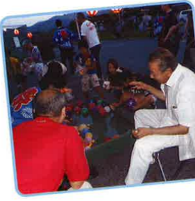
▲みんなで風船釣り

今後も引き続き地域とのつながりを大切にしながら、オープンな施設運営と利用者へのサービス向上に取り組んでいきます。