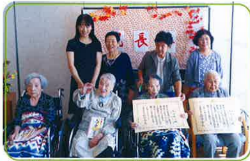
▲100歳以上の方々の表彰

特別養護老人ホーム星の里では、9月11日(日)に敬老会を開催しました。入所者の皆さんとご家族合わせて約100人の方が参加し、長寿者のお祝いと向東町で活動している「天女浜ダンサーズ」による踊りの鑑賞を行いました。