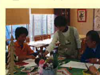
▲熱心に先生の指導を聞いてます

また、作品展に応募し、入選をする人も多くなりました。自分の作品が展示されると、利用者さんは「見て見て!」、「恥ずかしくなっちゃう」と喜んでいきます。