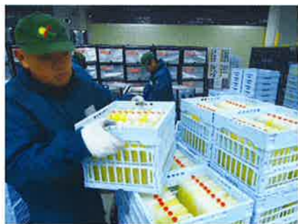
▲洗浄用コンテナに蓄冷材を詰め替える作業

実習に参加する利用者さんは、食堂や更衣室等の設備をシーエックスカーゴ従業員と同じように使っています。作業能力の向上だけでなく、一般企業の「環境」を利用者さんが日々体験し、就職したときのイメージを付けやすくする狙いがあります。