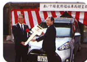
▲星の里で行われた贈呈式

一般財団法人中国地方郵便局長協会から、星の里ケアハウスへ車いす積載用福祉車両の寄贈がありました。車両は「トヨタシエンタX1500CC」で、9月23日に贈呈式を行いました。