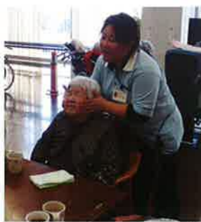
▲唾液腺のマッサージ