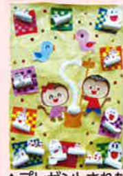
▲プレゼントされたかわいい壁画