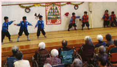
▲利用者さんの視線は園児にくぎづけ

会の終わりに、幼稚園の先生の経験がある利用者さんが代表してお礼を伝えました。また、園児からはお猿さんが餅つきをしている壁画がプレゼントされ、現在はデイサービスセンター星の里のフロアに飾られています。