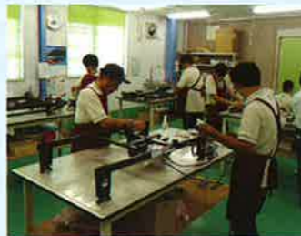
▲仲間と協力して丁寧に消毒

本人の思いに耳を傾けるために、本人の状況や状態に合わせて面談も行います。面談内容は、作業だけでなく普段の生活や将来のことなどさまざまですが、どんな内容でも傾聴することを心がけています。また、休憩時には雑談をしながら和気あいあいとした雰囲気を作り、作業時間とのメリハリをつけることも心がけています。