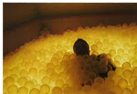
脳を活性化させるための空間

昨年の秋、全国の施設職員16名と一緒にイタリアとデンマークの障害者施設の視察研修に参加しました。自閉症施設、作業所、入所施設など6施設を視察しました。 社会保障制度や年金、税金の違いはありますが、視察した入所施設では、居室は全て個室でトイレ、お風呂、キッチンが完備されています。広々とした部屋は個性を生かしたレイアウトで、その人らしさがうまく表現されていました。 文化や宗教によって、障害者に対する考え方や制度、法律の仕組みに違いがあることなどを学びました。しかし一人一人に焦点を当てた支援を大切に考える方は日本もヨーロッパも共通したものでした。