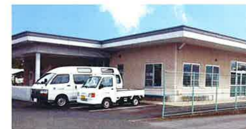
▲移管が決まった清風園

これらの人的資源やネットワークを総合的に活用することで、生活困窮者等に対するセーフティネットの役割、地域生活移行の推進及び日常生活の自立支援の取り組みを、より質の高いレベルで実現することを目指します。