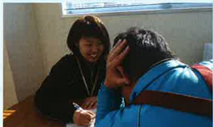
▲聴き方を工夫しながら面談

利用者さんが心を開いてくれたと感じる瞬間に、やりがいを感じます。新任職員として4月に配属され、お互いに手さぐりでの関係作りが始まりました。相手の思いや考えがすぐに理解できず、悩んだり落ち込んだりすることもありました。時間をかけながら向き合うことで徐々に本音で話してもらえるようになり、共感できる部分が増えました。一緒に活動しているからこそ感じられる毎日の小さな喜びが、大きなやりがいとなっています。