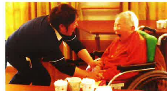
▲大きく口をあけて…

介護施設の歯科衛生士の業務には、他職種と協働し、口腔ケアを通して全身の機能維持を図り、利用者さんのQOLを維持していく役割があります。口腔内を清潔に保つだけではなく、嚥む、飲み込む、話すなどの機能を維持し、可能な範囲でそれらの機能向上のための支援をしていくことが求められます。