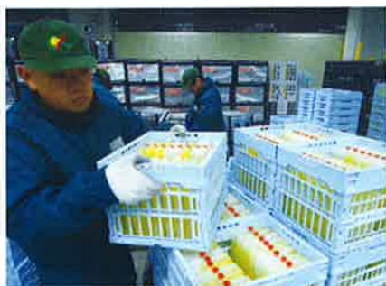
▲洗浄用コンテナに蓄冷材を詰め替える作業