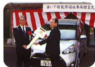
▲星の里で行われた贈呈式

一般財団法人中国地方郵便局長協会から、星の里ケアハウスへ車いす積載用福祉車両の寄贈がありました。車両は「トヨタシエンタX1500CC」で、9月23日に贈呈式を行いました。