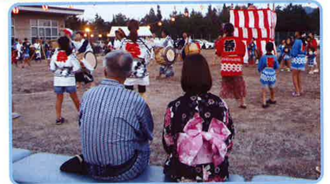
▲みあがりおどり観賞中

8月6日、夕暮れ時の18:00から地域の方々の協力を得て「みつぎ清風園盆踊り大会」を盛大に開催することができました。施設では一番大きな行事です。当日は天気も味方してくれ、総勢約300名の参加者で賑わいました。