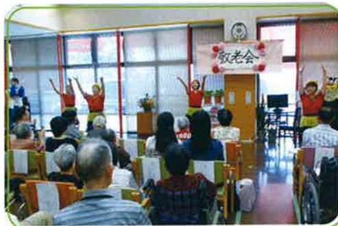
▲天女浜ダンサーズによる踊りの鑑賞