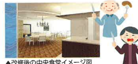
▲改修後の中央食堂イメージ図