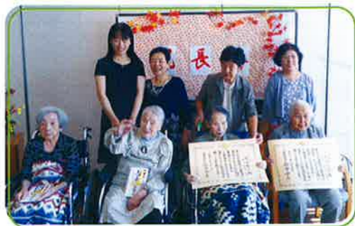
▲100歳以上の方々の表彰

特別養護老人ホーム星の里では、9月11日(日)に敬老会を開催しました。入所者の皆さんとご家族合わせて約100人の方が参加し、長寿者のお祝いと向東町で活動している「天女浜ダンサーズ」による踊りの鑑賞を行いました。