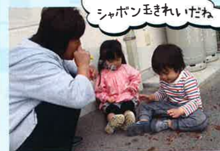
シャボン玉きれいだね