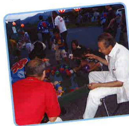
▲みんなで風船釣り

今後も引き続き地域とのつながりを大切にしながら、オープンな施設運営と利用者へのサービス向上に取り組んでいきます。