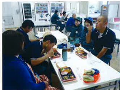
▲従業員の方々と食事中

さらに従業員の方々との接点が生まれることで、従業員への障害者の理解にもつながればと考えています。従業員との人間関係構築は始まったばかりですが、シーエックスカーゴと協働し、一人でも多く利用者さんの就職につながるよう努めていきます。