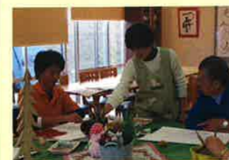
▲熱心に先生の指導を聞いてます

また、作品展に応募し、入選をする人も多くなりました。自分の作品が展示されると、利用者さんは「見て見て!」「恥ずかしくなっちゃう」と喜んでます。