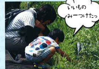
いいものみつけたっ

子ども一人ひとりの発達に合わせた療育活動を通して、「人と遊ぶことが楽しい」「自分っていいな」という意欲や自信を高める取り組みを行っています。また、保護者の方へは、発達についての学習会や子どもの成長を一緒に確認することで、じっくりと子どもと向き合うことができるように支援しています。