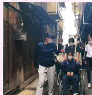
◀車いす体験で路地を散策

尾道福祉専門学校1年生は、2年間お世話になる尾道の街にくり出して授業を受けました。車いす体験では、ちょっとした段差がたくさん。「どうすれば乗り心地が良くなるのか」と考えながら行きました。また、散歩しながら「街のやさしさ探し」。全ては利用者さんの外出支援が楽しいひと時になるための学びです。