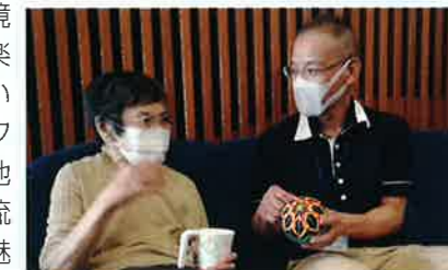
▲利用者さんの話にしっかり耳を傾けます

介護技術を日々向上できるように研修が充実しており、未経験者でも安心して学びながら仕事ができます。上司とも相談しやすい環境で、日々笑顔で楽しく仕事をしています。またサークル活動もあり、他の事業所とも交流ができることも魅力の一つです。