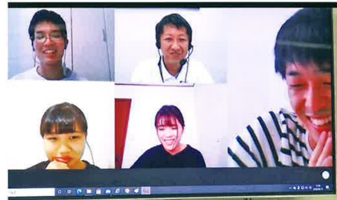
▲オンラインで参加の学生

今年で3回目を迎えた、企画立案型のインターンシップ「スタディツアー」を、9月9日から2日間にわたり開催しました。