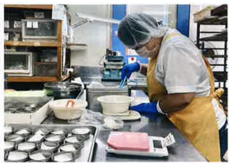
▲緻密な手作業が得意です