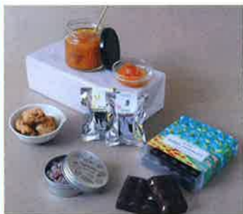
製法にこだわった「SATSUKI」ブランド商品