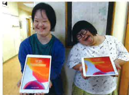
▲楽しい活動ができそうです!!

*ICT…情報や通信に関する技術の総称。通信技術を利用したコミュニケーションの意。