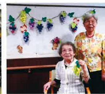
▲おいしそうなブドウが実りました

デイサービスでは今まで生け花、絵手紙、習字などの行事を開催していましたが、コロナウイルス感染症の関係で休止となっています。行事参加を楽しみにしている利用者さんが多く、何か達成感を得られるものはないかと考え、壁画作りを行ってみました。