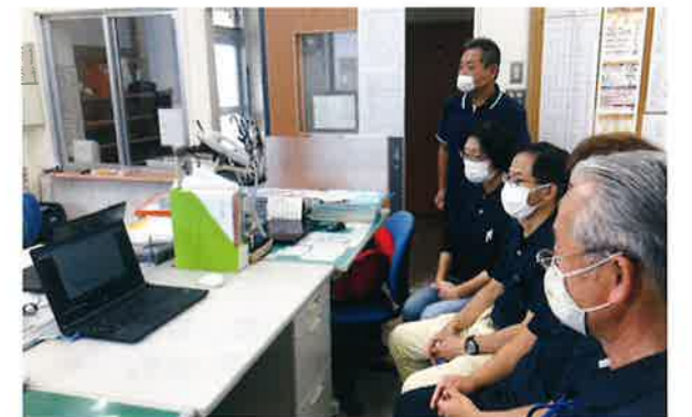
▲学生のプレゼンテーションを視聴する職員