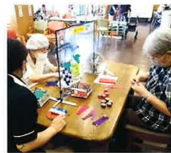
▲ブドウを作っているところ