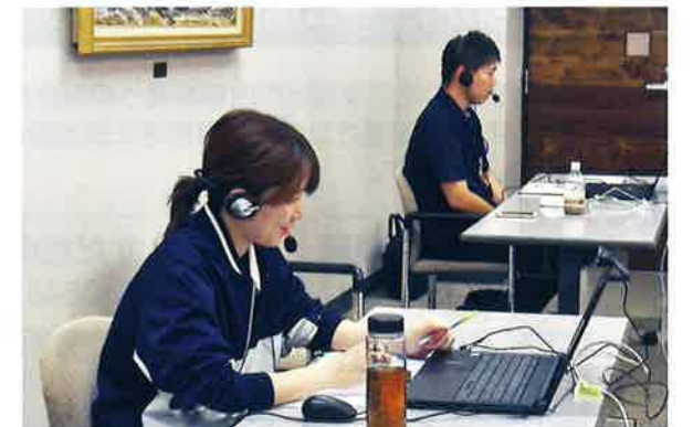
▲画面を通して理解を深めます

福祉学部以外の学生も多く参加するスタディツアーでは、福祉について知る機会だけでなく、実習などでは味わえない福祉の一面を知る機会を提供しています。インターンシップへの参加が当たり前になっている時代のなかで、福祉事業の理解が深まるよう、引き続き選ばれるインターンシップを開催していきます。