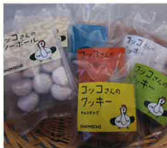
素材を精選した手作りの「ココさんのクッキー」6種類