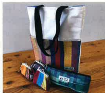
さをり織りでお馴染みの「織り屋おのみち」ブランド商品

どの商品も利用者さんと協働し、毎日丁寧に手作業で作られています。この機会に尾道さつき会の自主製品を手にとっていただければと思います。