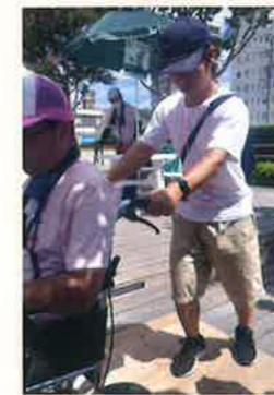
▲車椅子の救出体験をする参加者

学生が手がけた体験型イベント「オノザニア」は、介護福祉士の仕事に触れる体験型コーナーで、3つのアクシデントを解決するものでした。車いすが溝