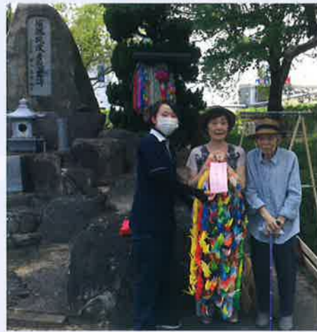
▲東尾道西緑地 慰霊碑にて

あることで、普段は手作業やレクリエーションに参加されない方も積極的に作成され、折り方がわからない職員や周りの方に折り方を伝えている場面もありました。