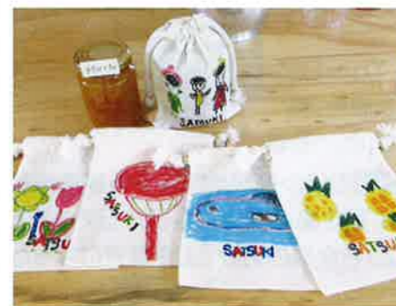
▲利用者さん直筆の巾着袋

今回のさつき喫茶を通して、「自分たちの働く姿を見てもらえたこと」「お客様と交流ができたこと」「丹精込めて作った商品を笑顔で買っていただけたこと」など利用者さんにとって、数少ない貴重な経験を積むことができました。