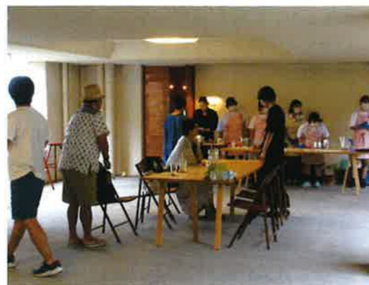
▲おかげさまで大盛況