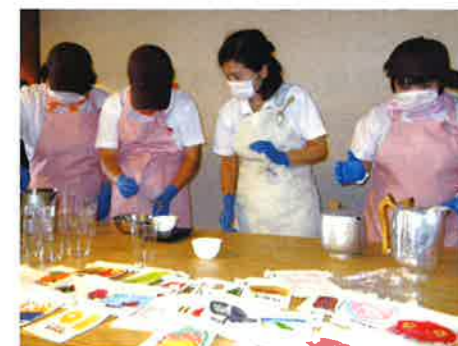
▲みんなできっちり役割分担