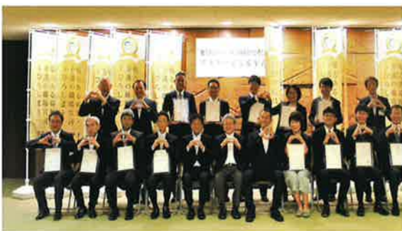
▲プラチナ認証授与式の様子

プラチナ認証は離職率が低く、職員が安心して長く働き続けられる取り組みをしているなど「広島県の福祉・介護業界のトップランナーといえる法人」といえます。