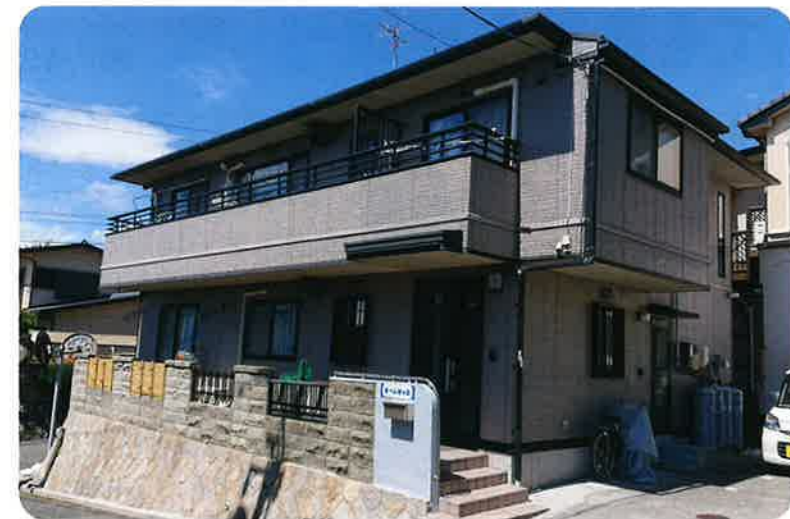
▲ホーム旭ヶ丘の外観