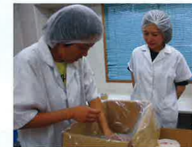
▲箱詰め作業を支援中

一歩前に進み、時には立ち止まりながら利用者さんと支援者が共に考え決定し行動したとき、利用者さんの自信をもった顔や自分の意見を言う姿を目の当たりにして喜びを感じることが出来ます。また、先輩方は提案した新しい取り組みを積極的に受け入れた上で、意見や方法を教えてくれるので充実した仕事ができます。