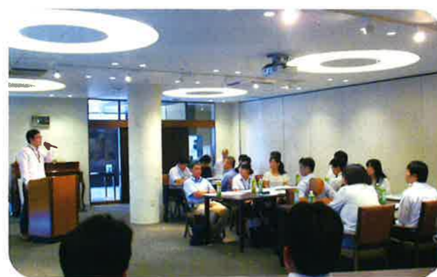
▲職員から話を聞く教員