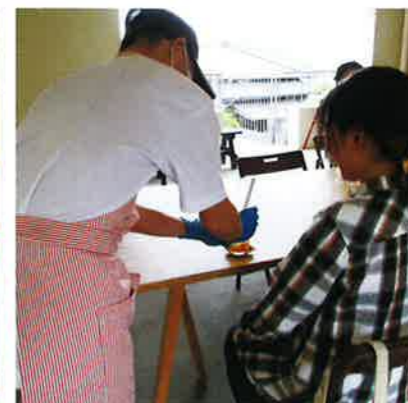
▲マーマレードティーを提供

尾道さつき作業所では、チョコレートやマーマレードなどの自主製品を製造し宿泊施設のLOGや複合施設ONOMIC HI U2などで販売しています。