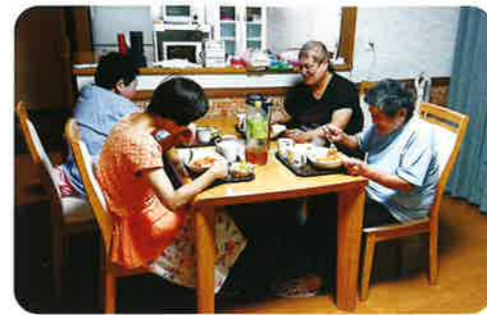
▲夕食を摂りながら団欒中

の賃貸アパートを3部屋借り、男性2名、女性4名の計6名が入居していましたが、各部屋が離れており、職員の見守りなど支援体制に課題がありました。今回、一戸建て(1階個室2部屋、2階個室4部屋)のホーム旭ヶ丘に移転したことにより、支援を提供しやすい環境が整いました。また、男性が1階、女性が2階と、フロアごとに男女の住み分けがされている点は、法人内の他のグループホームにはない特徴です。