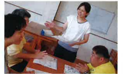
▲マナー勉強会をしている寄井職員

周りの人に意見を受容してもらった経験から、やる気や考える力、個人の良さを引き出すことを意識した支援をしています。また、同じ事柄に対して立場や状況によって全く違う意見があるという面白さを知った経験から、チームで意見を出し合い新しい事に挑戦していきたいという思いにつながっています。